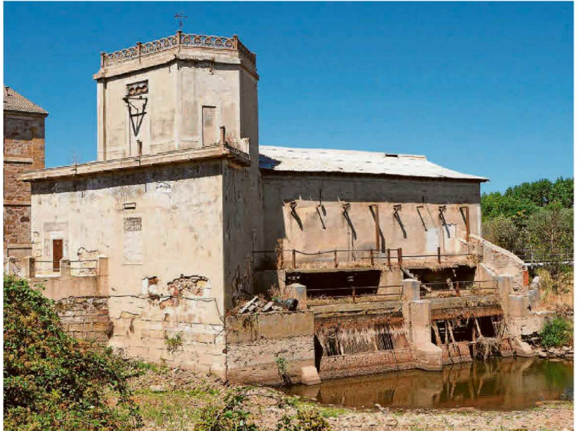
Edificio de la antigua central hidroeléctrica de Tejares, conocida como la Fábrica de la Luz y que se convertirá en centro de interpretación del río.

Conforme a la memoria valorada que la administración local posee de este proyecto, la antigua Fábrica de la Luz se someterá a una rehabilitación que incluye la reposición de los elementos y materiales originales que se han perdido, así como la reparación de las lesiones detectadas en la estructura. También se prevé recuperar los elementos y maquinaria vinculados con la infraestructura hidráulica, como los filtros, tajamares, compuertas y socaz, si bien es cierto que el estado de algunos de ellos no se ha podido testar ante la imposibilidad de entrar en el edificio por su estado ruinoso. Además, para subrayar su valor etnológico, patrimonial y cultural, el Consistorio dotará de iluminación artística tanto al propio edificio como a otros elementos de arquitectura industrial que se encuentran en el entorno. La intervención incluye, al margen del desbroce de la zona que actualmente se encuentra invadida de vegetación, trabajos arqueológicos que permitan comprobar si existen restos de la antigua pesquera y de las aceñas originales de Tejares,